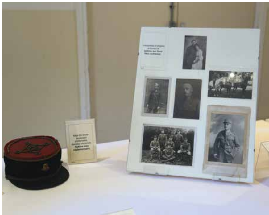
L'exposition présente des documents et pièces d'origine rares, parfois même exceptionnels.

expliquer la raison d'être de l'insigne au sphinx, le lien entre André Maurois et le colonel Bramble, ou simplement pour regarder les photos tirées du magazine d'époque Le Miroir , qui « paie n'importe quel prix les documents photographiques relatifs à la guerre, présentant un intérêt particulier ».