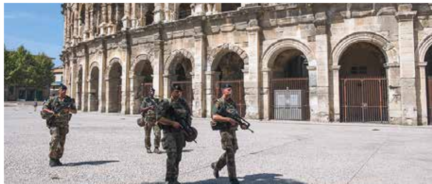
Patrouille à pied du 19 e RG devant les arènes de Nîmes. La surveillance des lieux touristiques reste une priorité.

Décrété par le président de la République dans la nuit du 13 au 14 novembre 2015, l'état d'urgence a été renouvelé à six reprises sans discontinuer jusqu'au 31 octobre 2017. Ce régime d'exception que le Président souhaitait interrompre pour « revenir au droit commun (...) et agir avec les bons instruments » a donc cédé la place le 1 er novembre à la loi n° 2017-1510 du 30 octobre 2017 renforçant la sécurité intérieure et la lutte contre le terrorisme. Pendant cette longue période, l'état d'urgence a permis selon le ministre de l'Intérieur, d'effectuer 4 457 perquisitions administratives, de saisir 625 armes dont 78 de guerre, d'assigner à résidence 752 personnes et surtout de déjouer 32 projets. Malgré le vote de cette loi, le ministre n'a pas pour autant enterré l'état d'urgence : « s'il y avait un meurtre de masse - ce qu'on a pu connaître au moment du Bataclan - c'est possible qu'on soit obligé de le [NDLR : l'état d'urgence] remettre, mais nous allons faire en sorte que nous puissions gérer des situations de crise. Si elles devenaient extrêmement dramatiques, nous pourrions revenir à cet état d'urgence », a affirmé Gérard Collomb le 1 er novembre sur BFMTV.