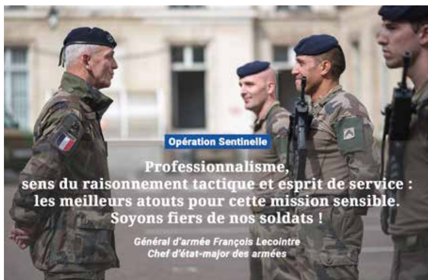
Message et photo postés le 1 er août 2017 sur Twitter Etat-Major Armées : « Soyons fiers de nos soldats ! Rencontre du général Lecointre avec les militaires de l'opération #Sentinelle ».

C'est pourquoi, a ajouté le chef d'état-major de l'armée de terre, je souhaite pousser d'autres services, notamment ceux de l'État, à imaginer des scénarios de crise dans leur environnement. Dit autrement : à certains endroits, il vaut mieux mobiliser 25 spécialistes de la sécurité civile, de la menace bactériologique ou chimique, plutôt que