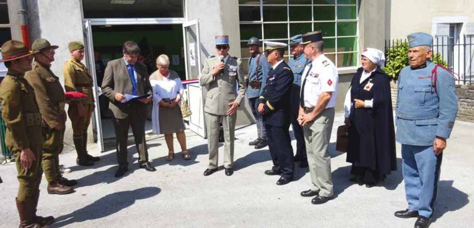
Inauguration de l'exposition de Biesles en présence d'autorités civiles et militaires, et de reconstituants en tenue d'époque.