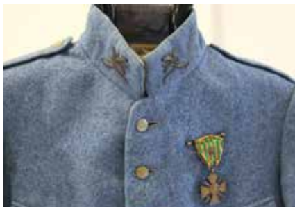
Vareuse d'un interprète stagiaire d'allemand (adjudant-chef) reconnaissable par ses branches d'olivier au collet.

Las, souvent la récolte est bien maigre, et après avoir écumé Internet et acquis de nombreux livres (romans, souvenirs, manuels, glossaires) couvrant la période allant de la création de la spécialité en 1798 à l'époque actuelle, il avait bien fallu se résoudre à de maigres succès.