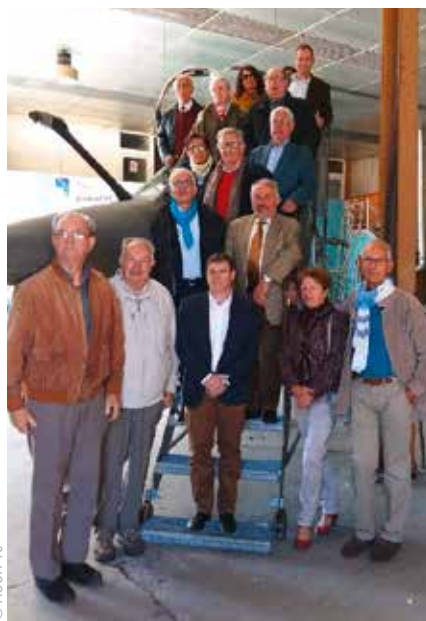
Le Mirage F1 du Normandie-Niemen a volé entre 1980 et 2004.

Le Mirage F1 entreposé depuis le mois d'avril dans un hangar de l'aérodrome de Brive-Laroche, a permis aux membres de l'Association des officiers et cadres de réserve de la Corrèze de découvrir en octobre dernier cet aéronef qui a appartenu à l'escadron Normandie-Niemen. Ce Mirage qui avait pris son envol en 1980, a terminé sa carrière en 2004 au Bourget, après 6 266 heures de vol, et après avoir notamment combattu en Bosnie, au Tchad et au Congo. Les membres de l'AIRAC, l'Association interactive pour la recherche et la mise en valeur des richesses aéronautiques et spatiales de la Corrèze, ont ramené l'avion de