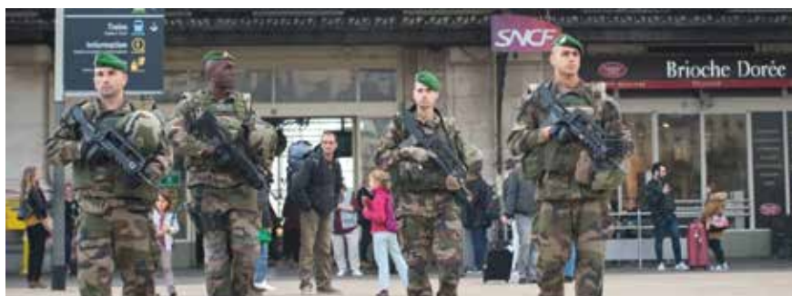
En 2016, la 8 e Cie du 2 e REI engagé à Paris dans l'opération Sentinelle était composée de réservistes.

Cette évolution qui concernera toujours 7 000 militaires, avec une capacité de mobilisation pouvant, en cas de besoin, être portée à 10 000 soldats, comporte désormais un dispositif à trois niveaux rendant la force plus flexible, réactive et imprévisible par la concentration des efforts selon l'évolution de la menace :