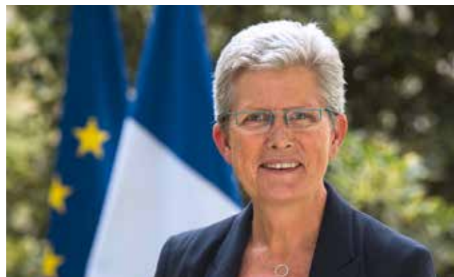
Madame Geneviève Darrieussecq, secrétaire d'État auprès de la ministre des Armées