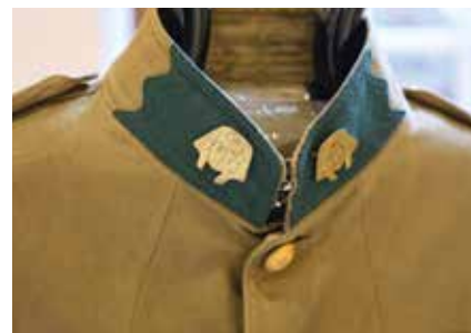
Uniforme américain d'époque reconstitué en tenue d'interprète pour les Sammies à l'aide d'insignes authentiques d'époque aussi.

une exposition pendant ces années de commémoration de la Grande Guerre. La première exposition a été réalisée à Saint-Witz (Val d'Oise) où trois uniformes étaient présen-