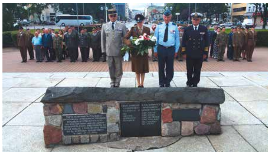
Dépôt d'une gerbe au monument aux morts de Gdynia.

Initialement pensée comme un vecteur d'influence vis-à-vis des anciens membres européens du Pacte de Varsovie, elle s'enrichit désormais de stagiaires issus de partenariats avec l'OTAN tels que « Partnership for Peace » (Géorgie, Ukraine Macédoine) ou « Mediterranean Dialog » (Tunisie). Principalement destinée à la formation