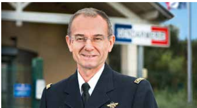
Le général d'armée Richard Lizurey , directeur général de la gendarmerie nationale.

[Général d'armée François Lecointre, CEMA]