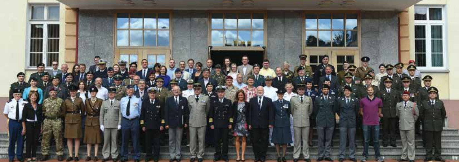
Le millésime 2017 de l'Académie des langues de la CIOR : 81 stagiaires et dix-neuf encadrants, représentant collectivement dix-sept nationalités, devant les locaux de l'Académie navale de Gdynia en Pologne.