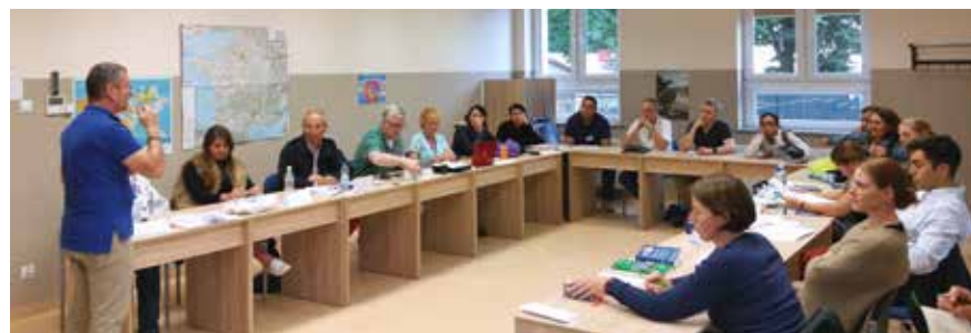
Trois classes de français ont été organisées, regroupant des stagiaires de différents niveaux.

Quand à Gdynia elle-même, c'est à partir de ses chantiers navals que se déploya le syndicat Solidarnosc pour ébranler le communisme et l'amener à sa chute en réfutant la peur qu'il inspirait. Passons rapidement sur les charmes d'une Gdansk refaite à neuf dans le respect de l'ancien, et les atouts balnéaires de Sopot. Incontestablement, le succès de l'Académie des langues repose sur le contexte culturel dans lequel s'effectue l'apprentissage. Le succès de son dernier millésime s'explique aussi par ce facteur. ■