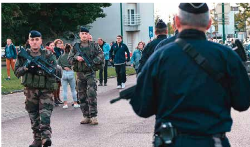
Les rencontres sportives rassemblant un grand nombre de spectateurs font l'objet d'une attention particulière des patrouilles Sentinelle comme ici du stade Malherbe à Caen. Les hommes du 6 e RG croise ceux de la gendarmerie.

Florence Parly, ministre des Armées [14 sept. 2017]