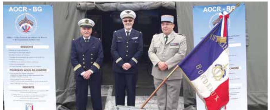
L'accueil des visiteurs était assuré par des adhérents et des membres du bureau de l'AOCR-BG dans un dispositif résolument interarmées.

Pour assurer le niveau optimal de sécurité, les démonstrations aériennes se sont intégrées dans le trafic aérien de l'aéroport qui a dû modifier légèrement le programme de vol de la journée.