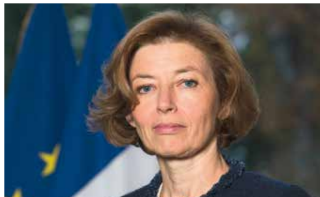
Madame Florence Parly, ministre des Armées.

La Garde nationale fera l'objet d'un réexamen dans le