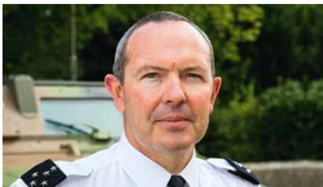
Le général d'armée Jean-Pierre Bosser, chef d'état-major de l'armée de terre.

« Chaque jour, ce sont plus de 600 réservistes qui viennent appuyer l'armée de terre ; je vise un nombre compris entre 800 et 1 000. »