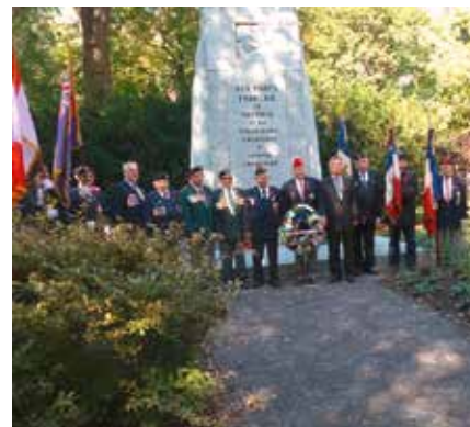
Cérémonie avec dépôt de gerbes , le 6 octobre 2017, au monument du parc Lafontaine à Montréal, en présence des associations d'anciens combattants française et canadiennes.

Exposition et conférence se sont tenues au Cercle de la garnison. Bien que de nombreuses personnalités militaires étaient présentes, l'investissement dans notre accueil par nos hôtes n'a pas été à la hauteur de notre propre