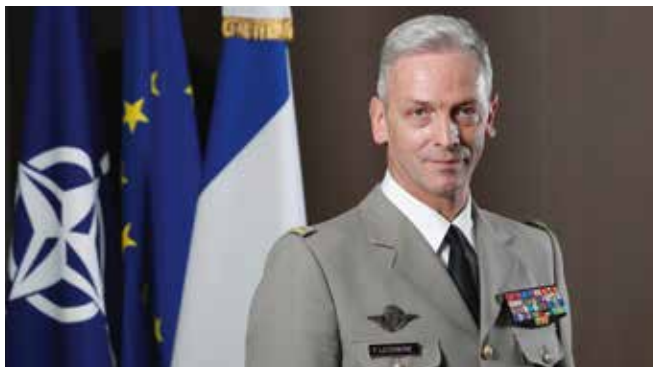
Le général d'armée François Lecointre , chef d'état-major des armées.

GDA François Lecointre - En ce qui concerne les réservistes, les armées ont fait ce qu'elles pouvaient faire. On observe une montée en puissance importante des réserves, dans le cadre du projet de Garde nationale lancé il y a un peu plus d'un an. La réserve des armées est ainsi forte de 35 000 réservistes, ce qui est proche de nos objectifs, puisque sur la cible de 85 000 hommes prévus pour la Garde nationale, 40 000 concernent les armées. Nous allons donc atteindre nos objectifs, avec un taux d'emploi sur le territoire national qui devrait atteindre, pour l'année en cours, mille réservistes par jour. Cette augmentation du taux d'emploi des réservistes est indispensable si nous voulons rentabiliser la formation, qui prend du temps et de l'énergie.