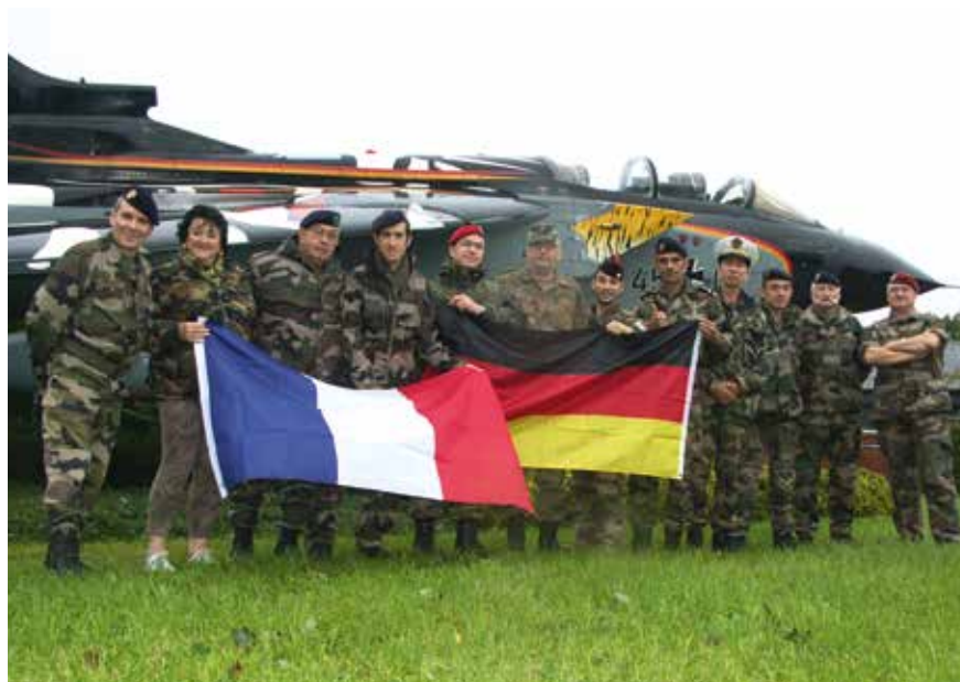
La délégation de l'UNOR Côte d'Azur s'est rendue en Allemagne dans le cadre du jumelage franco-allemand.

La journée du 12 septembre fut consacrée à la découverte du Bataillon 911 Eloka , à Stadum. Cette unité interarmées est spécialisée dans la guerre électronique, l'écoute, la cyberdéfense au profit des trois armées. L'exploitation, l'analyse des