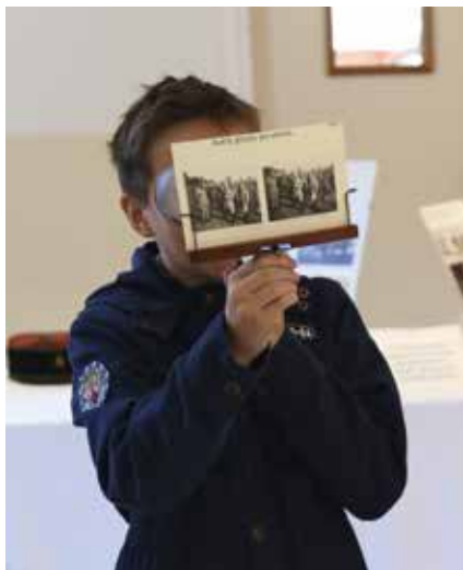
Les enfants ont pu tester le stéréoscope mexicain montrant des photos d'interprètes en action et en relief.

Pas un instant de répit, à peine le temps d'aller déjeuner ! Les visiteurs, jeunes et moins jeunes, se pressaient pour tester le stéréoscope mexicain montrant des photos d'interprète en action et... en relief ; pour se faire