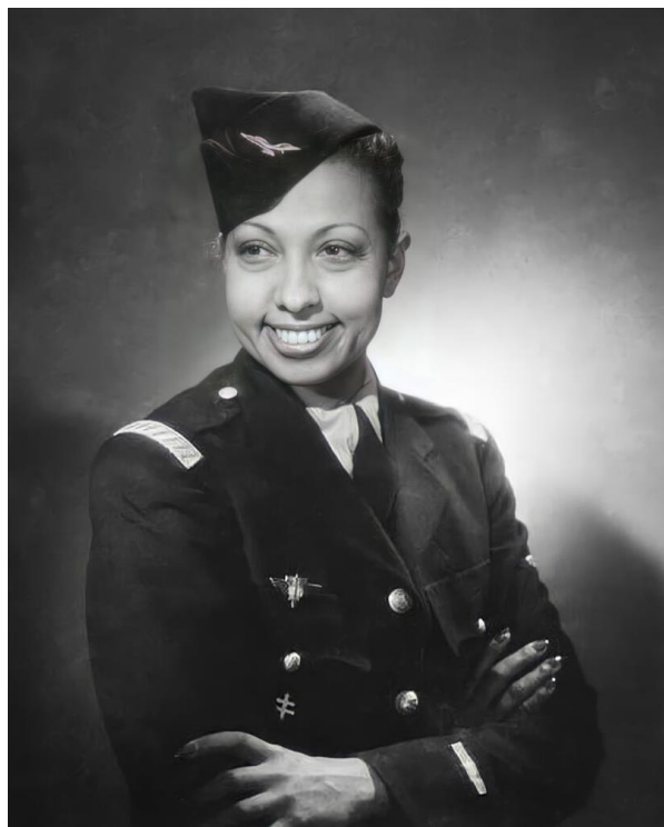
Le sous-lieutenant Baker