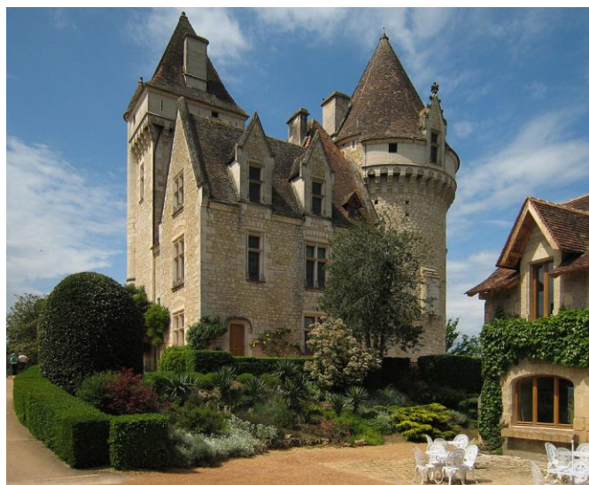
Le château des Milandes

Ne pouvant avoir d'enfants, Joséphine décide d'adopter des bambins de nationalités et de religions différentes. Pour abriter et élever ses douze marmots qui constituent sa « tribu arc-en-ciel », elle achète le château des Milandes et une partie du village de Castelnaud-la-Chapelle en Dordogne.