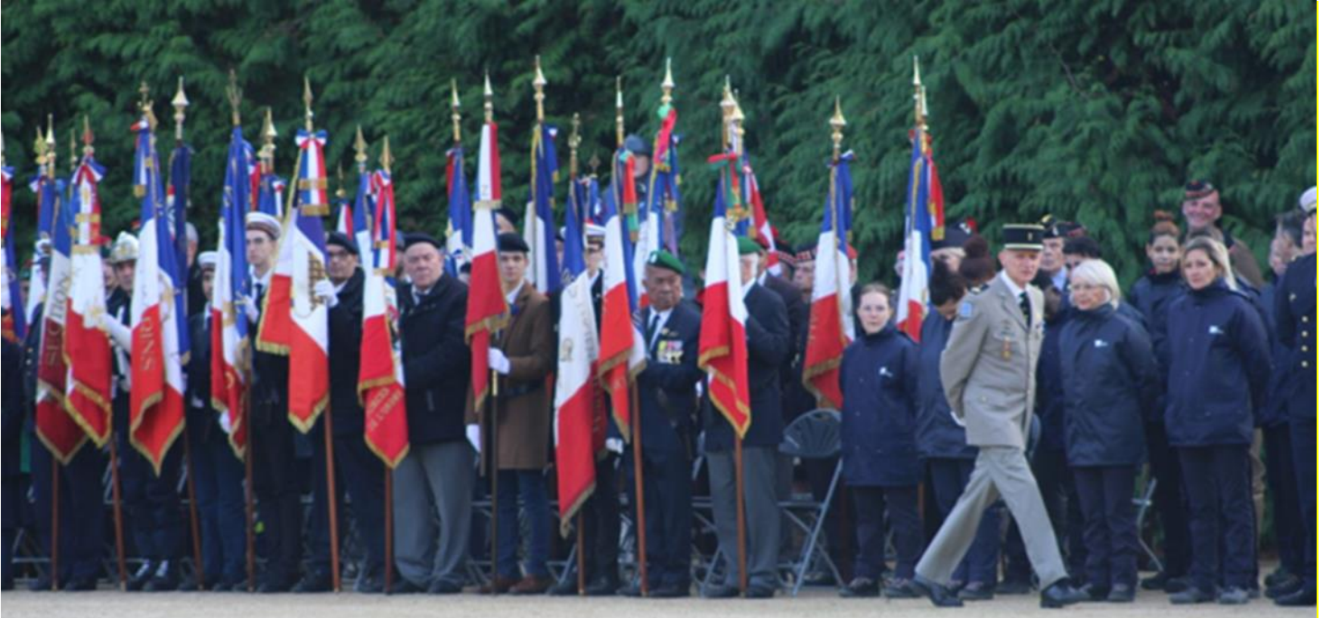
Cérémonies du 11 novembre 2022 dans la clairière de Rethondes. Porte-drapeaux, jeunes et anciens au coude-à-coude.